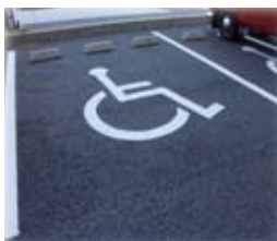
多様なニーズに応える 福祉型駐車場